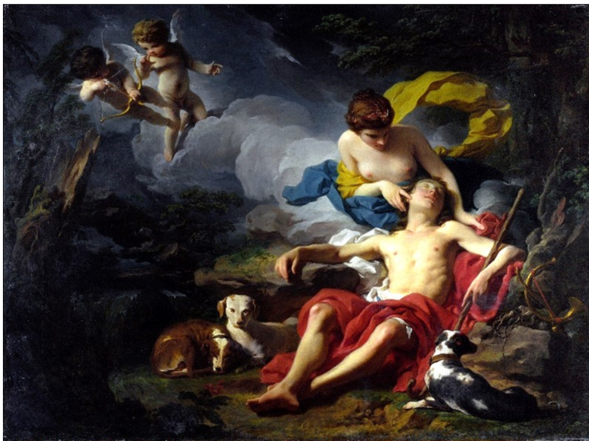
Pierre Subleyras, Diana ed Endimione , 1740 ca, olio su tela, Londra, National Gallery

La Sfida al Barocco è quella lanciata dagli artisti in nome della modernità con la sperimentazione di nuove forme e nuovi linguaggi di comunicazione elaborati tra il 1680 e il 1750. Una ricerca che si sviluppa tra Roma e Parigi, i due poli di attrazione dell'Europa moderna con cui la Torino di quegli anni intesse un intenso dialogo di idee e di scambio di opere e artisti, che contribuiscono a una stagione epocale di rinnovamento delle arti sulla scena internazionale.