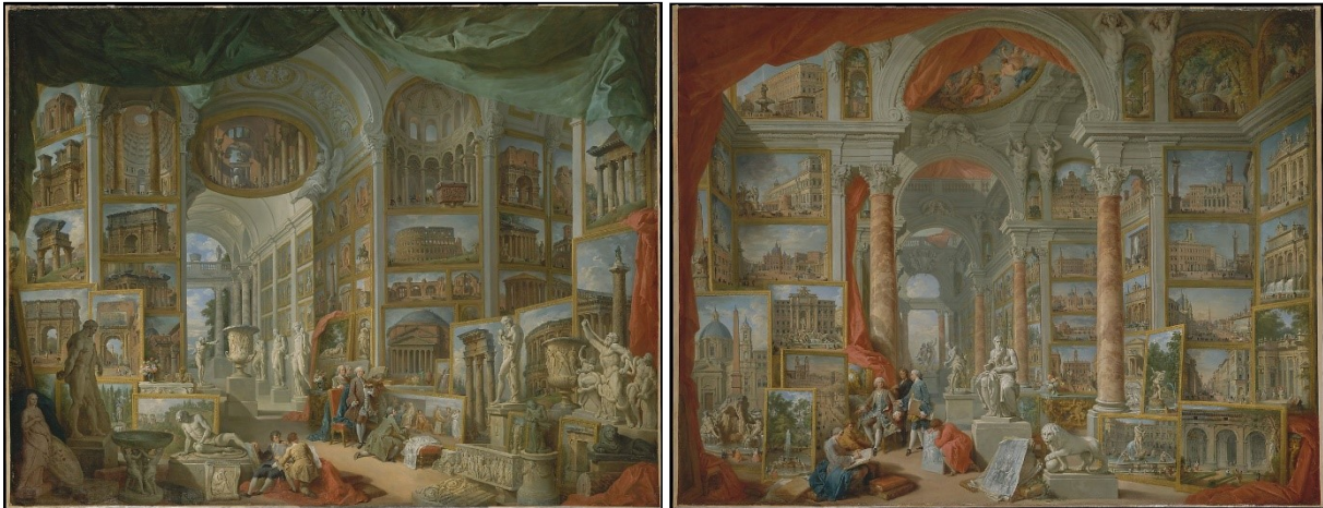
Giovanni Paolo Pannini, Roma Antica e Roma Moderna , olio su tela, 1757, New York, The Metropolitan Museum of Art